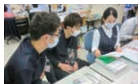
コンディショナル体験の様子

厚生労働省基幹型臨床研修病院 宮崎生協病院 では、医学生の実習を受け入れています。今回は、学年別のおすすめの実習プランを紹介させていただきます。実習希望の場合はご連絡ください。