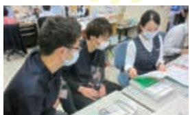
コンディショナル体験の様子

厚生労働省基幹型臨床研修病院 宮崎生協病院 では、医学生の実習を受け入れています。今回は、学年別のおすすめの実習プランを紹介させていただきます。実習希望の場合はご連絡ください。